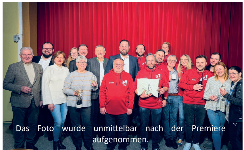
Das Foto wurde unmittelbar nach der Premiere aufgenommen.