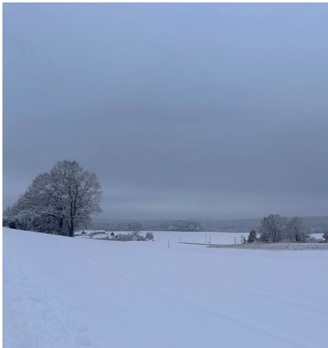
Schneelandschaft - fotografiert in Richtung Vollhof/Tannenbach von Frau Nicole Amschler.