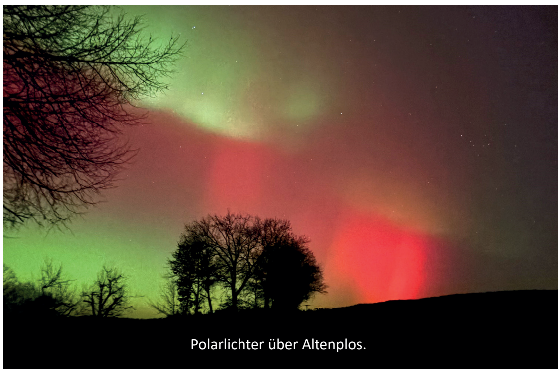
Polarlichter über Altenplos.

Lernbereit, aufgeschlossen & Lust auf eine neue Karriere oder solides Zusatzeinkommen? Jetzt Info anfordern info@chory.info